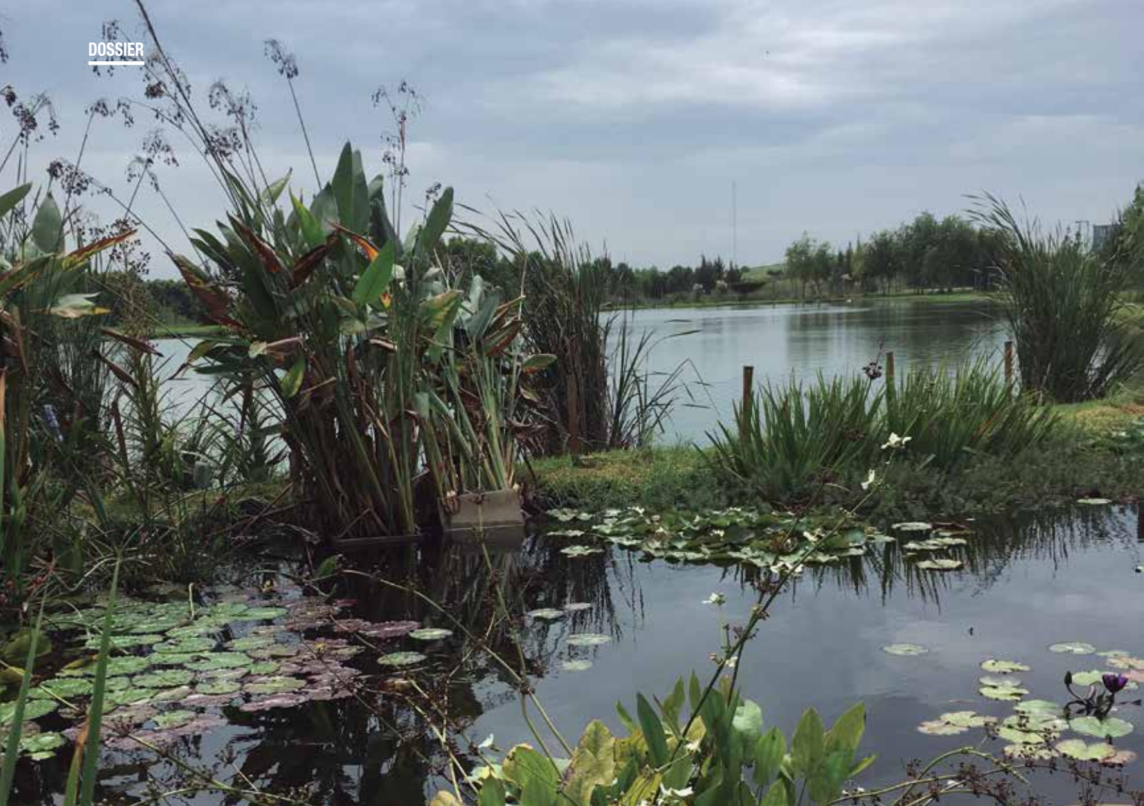
Estanque de agua en la planta de tratamiento de líquidos lixiviados (CEAMSE)