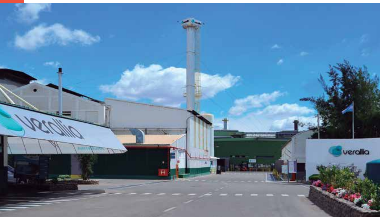
Planta Verallia en Mendoza