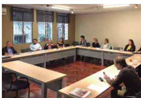
Los que asistieron a la reunión en la Alianza Francesa.