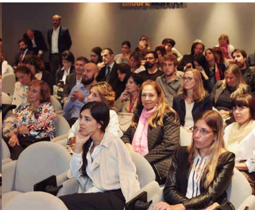
Vista general del evento.

de un país. Argentina está viviendo un momento histórico como sociedad en torno a este debate que se extiende obviamente al ámbito laboral. Para reflejar las necesidades de un mercado global diverso, las empresas deben fomentar la diversidad y la inclusión dentro de sus propias organizaciones. Además de crear una fuerza de trabajo más representativa, la diversidad también ayuda a construir una empresa más exitosa. Los lugares de trabajo con equilibrio de género presentan un mayor compromiso entre sus colaboradores, una imagen de marca más fuerte, un aumento de la ganancia bruta y un crecimiento orgánico consistentemente mayor según un estudio de la firma Deloitte. La palabra “mixité” viene del francés y su difusión en el ámbito corporativo tomó vuelo con el movimiento “Jamais sans Elle” que promueve la mixité en los coloquios, conferencias, debates y reuniones públicas a las cuales participan empresas. Asimismo, la diplomacia francesa invitó al conjunto de los Embajadores de Francia a sumarse