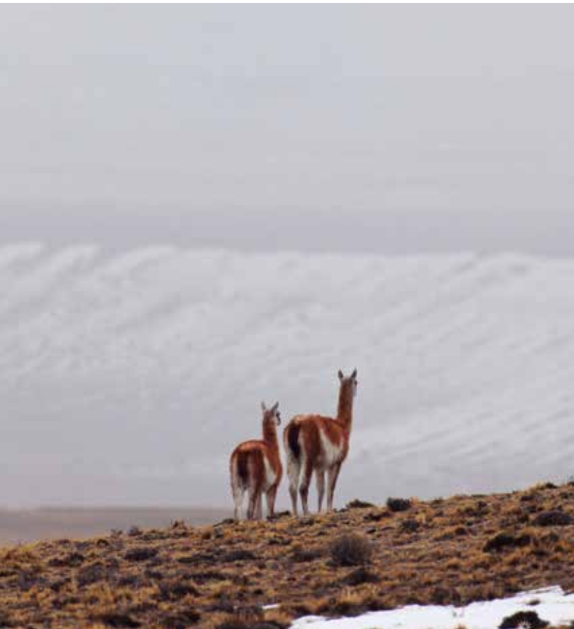
Vicúñas en los Andes.