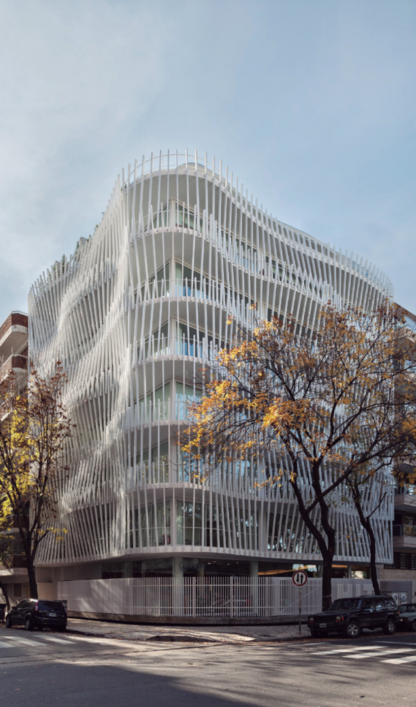
Hit Pampa, immeuble complètement dédié au co-working, inauguré en 2015