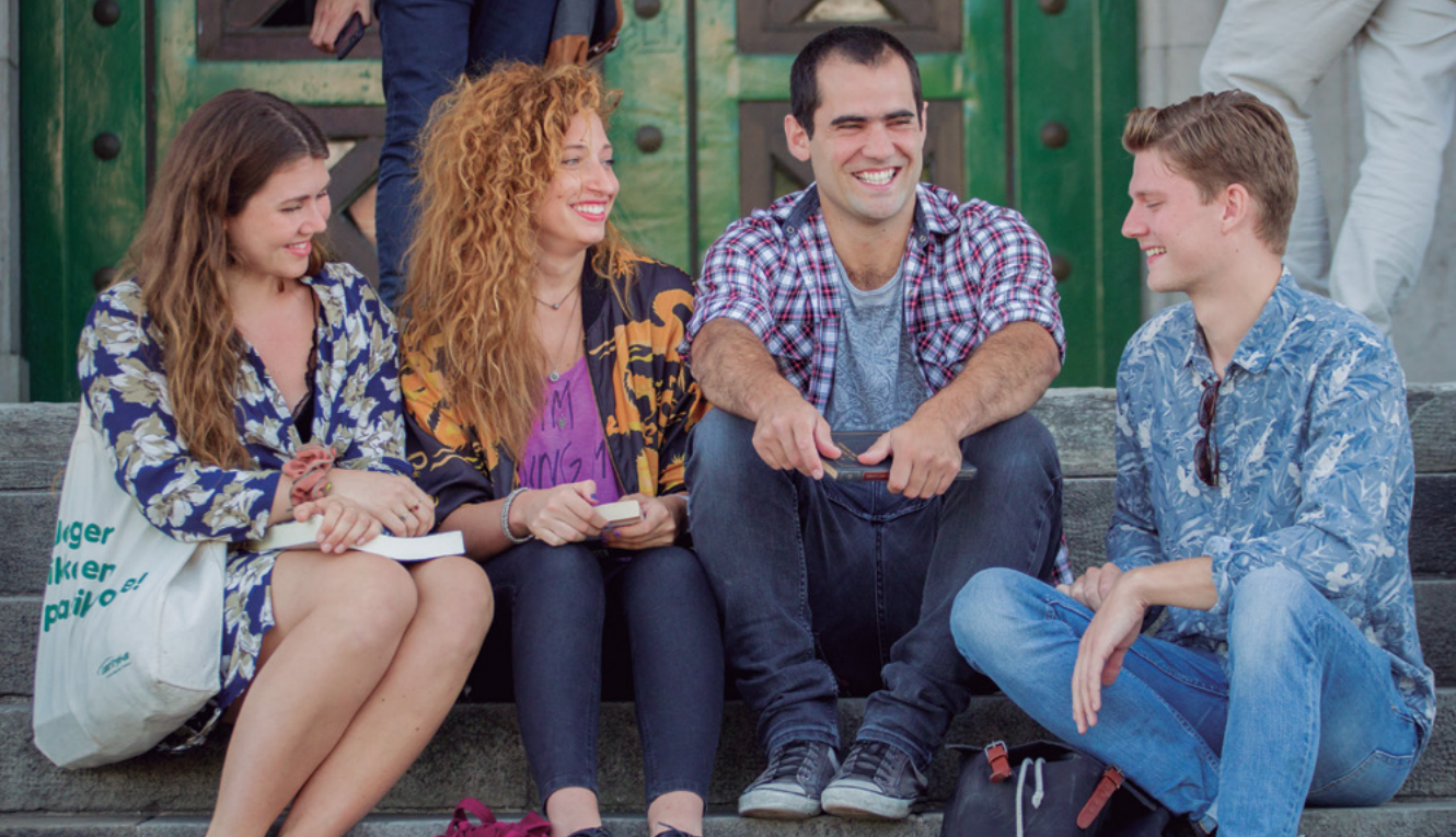
Étudiants universitaires.