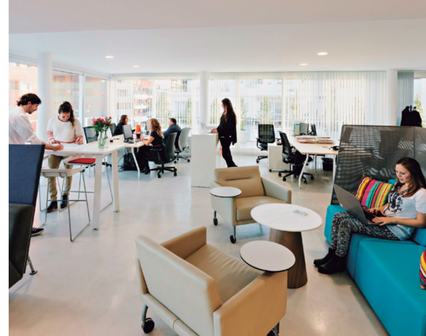
Exemple d'espace de co-working : le Hit Pampa

La technologie a rendu possible que pratiquement tout espace puisse être considéré comme « lieu de travail ». Les nouvelles options et les tendances actuelles.