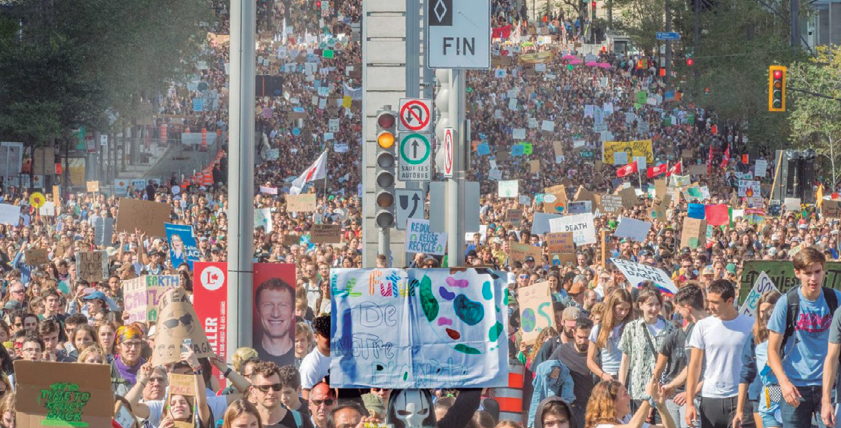
Marche pour le climat à Montréal

Le problème structurel de l'inclusion des jeunes dans le monde formel du travail en Amérique Latine est, probablement, un des obstacles les plus importants pour le développement et la dynamisation sociale.