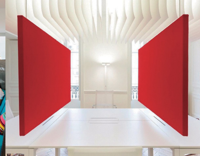
Design d'intérieur de bureaux par Scarlet Red

Le bureau de l'ère numérique est omniprésent, sans espace ni temps défini. Tout peut se faire à tout moment et sans importer le lieu. Il n'y a plus d'horaires dans les activités de travail, grâce à l'option multitasking fournie par les dispositifs mobiles, les réseaux sociaux et internet.