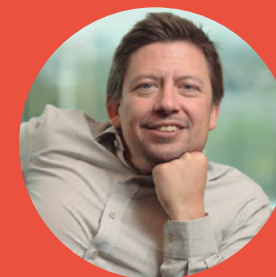
Par Pablo Maison

Greta est-elle l'expression d'une nouvelle génération qui a renouvelé ses demandes, ou ces nouvelles demandes ont donné comme résultat une Greta ? Quel est le futur du travail pour les nouvelles générations, et pourquoi les centennials exigent des changements aux entreprises et à notre manière de vivre et de prendre soin de notre planète ?