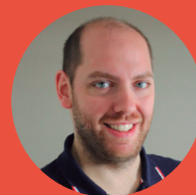
Par Dominique Croce

Le phénomène de l'on demand , arrivé à travers les millennials et qui s'étend à toute la société avec le smartphone , est en voie de changement.