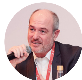
Par Federico M. Basile Associé au Cabinet Krause Avocats