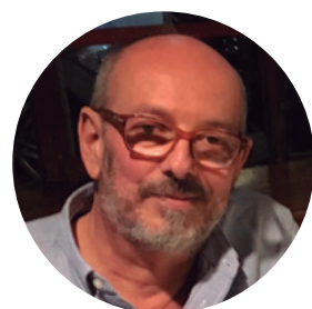
Par l'Architecte Gabriel Berman