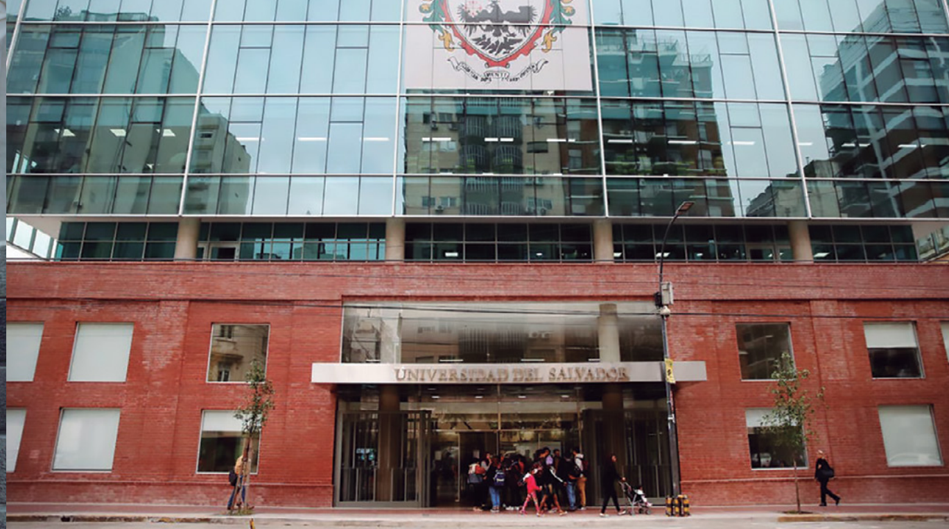
Nouvel immeuble durable de l'Université del Salvador.